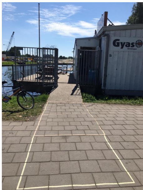
Figure 1 Vakken waarin KEI-lopers wachten.

Er wordt een lijst bijgehouden van mensen die langs zijn gekomen, hun volledige naam, de aankomsttijd, emailadres en telefoonnummer wordt genoteerd. Mocht er toch een COVID-19 uitbraak komen dan kan deze lijst gebruikt worden voor bron- en contactonderzoek. Wij vragen toestemming aan iedereen of hun gegevens gebruikt mogen worden door de GGD in het geval van bron- en contactonderzoek.