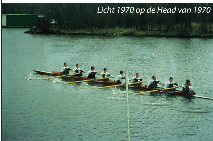
Licht 1970 op de Head van 1970

Een tiental mannen van rond de zestig jaar, sommigen hadden geen veertig jaar meer in de boot gezeten, als vanouds samen in de acht. Na afloop sprak een Gyas lid me aan; "Bart, zoals die mannen daar vanzelfsprekend aan de bar koffie staan te drinken, net een wedstrijd ploeg maar dan 40 jaar ouder."