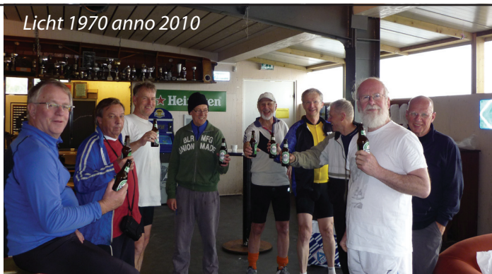
Licht 1970 anno 2010